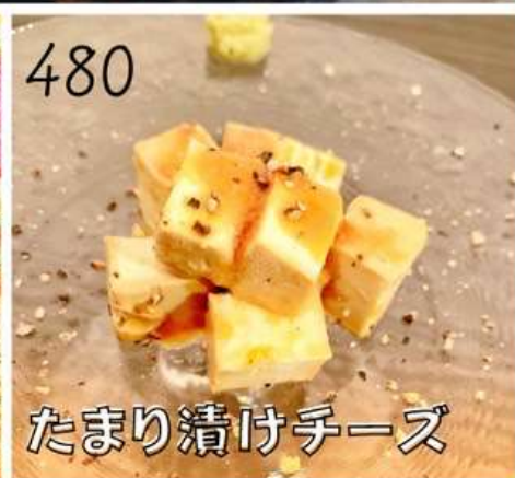
たまり漬けチーズ