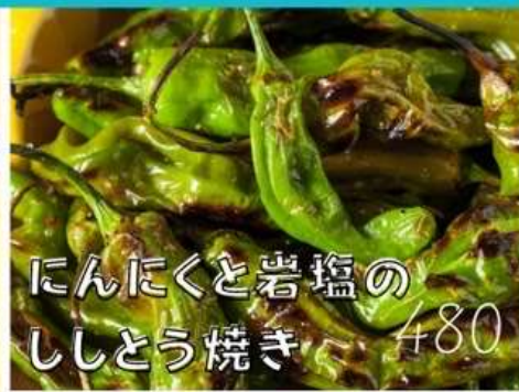
んにくと岩塩の ししとう焼き 480