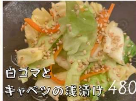
白ゴマと キャベツの浅漬け 480