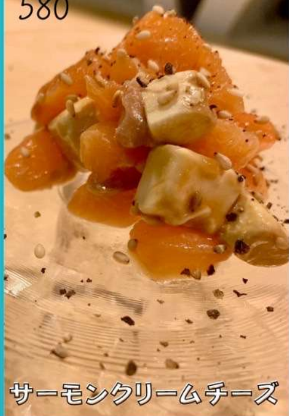
サーモンクリームチーズ