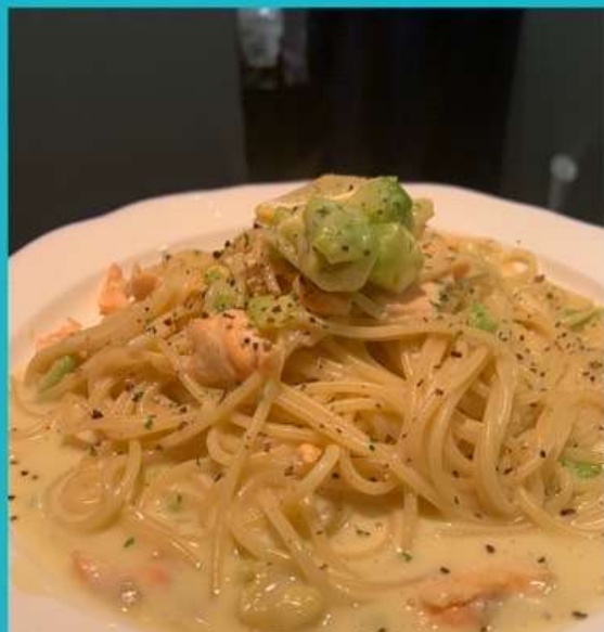
サーモンとアボカドの レモンクリームパスタ 990