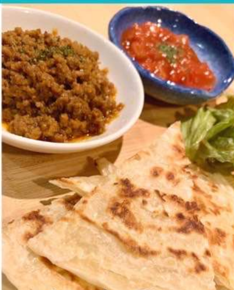
ヒラヤーチー風 タコス巻き 770