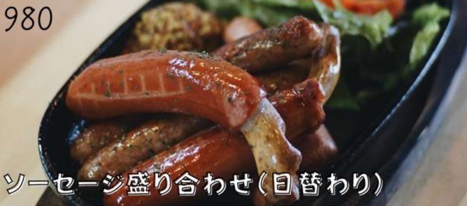
ソーセージ盛り合わせ(目替わり)